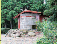
赤い土管が見えたらゴールまであと少し!