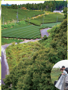
橋の上から見下ろす茶園の風景