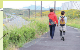
空港から続くまっすぐな道