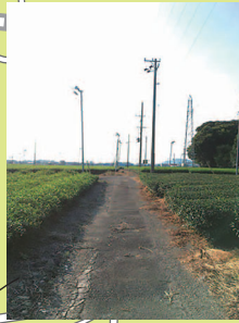
茶園の真ん中を進むまっすぐな道