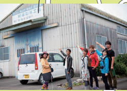
曲がり角の目印は松本製茶工場