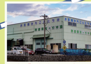
12 無農薬茶の杉本園 無農薬・無肥料の自然栽培した深蒸し茶を製造・販売。 0547-45-2003 島田市金谷猪土居3769-3