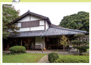
1 megori石畳茶屋 誰でも休憩ができ、展示室では企画展等が随時開催されており、島田市産の食材を使った料理と菓子を提供。 0547-45-5715 島田市金谷坂町2482-1