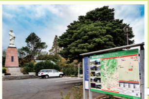
7 牧之原公園 宋(中国)から抹茶法という新しい飲み方を持ち帰り、また、「喫茶養生記」を著した栄西禪師を称える像。 島田市金谷富士見町1701-1