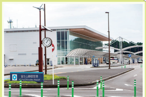
16 富士山静岡空港 2009年に開港した静岡県の空の玄関。ターミナルビル内等では搭乗しなくても楽しめる各種イベントを開催。 牧之原市坂口3336-4