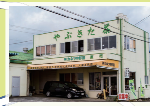
11 カネツ中野園 「深蒸し茶」など静岡茶の卸売を手掛けており、現地では直売所として茶を販売。 0547-46-1135 島田市金谷猪土居3634