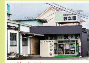
10 牧之園 美しい茶園から生まれる、静岡産の緑茶を製造・販売。 0547-46-1234 島田市金谷猪土居3629