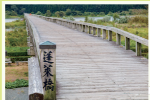
14 蓬萊橋 明治初期に、牧之原を開墾し茶を作りはじめた旧幕臣等が大井川を渡るために架けられた橋。 0547-32-9700 島田市南2丁目地先 ※蓬萊橋897.4(竹ノ茶屋のTEL/住所)