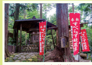
3 すべらず地蔵尊 滑らない山石を敷いた石畳の上に建立され「すべらず地蔵」と呼ばれる合格祈願や商売繁盛の人気スポット。 島田市金谷坂町