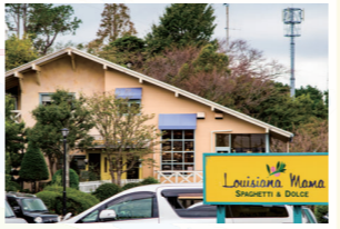
8 ルイジアナママ金谷店 カジュアルなイタリアンカフェで、大井川を見下ろす眺望が素晴らしい。夜景色は絶景。 0547-46-2263 島田市金谷富士見町1681-88