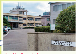
13 茶業研究センター 1908年に開所した県立施設で、地域に適した品種の開発や茶園管理の省力化などに関する研究を実施。 菊川市倉沢1706-11