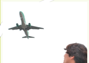
19 だいだらぼっち広場 清走路東端にある展望広場。駐車場やトイレが完備されていて、芝生やデッキに寝転んで眺める飛行機は迫力満点。 牧之原市坂口