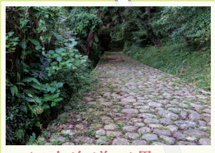
2 旧東海道石畳(金谷坂) 1991年に復元された江戸時代末期の街道の様子を今に伝える金谷坂の430mの石畳。 島田市金谷坂町