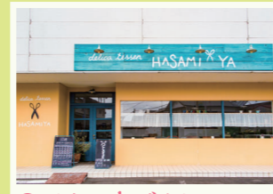
9 はさみ家デリカテッセン 雑貨屋のようなオシャレな外観の弁当店で、惣菜と陳列された弁当や惣菜を販売。 0547-46-2000 島田市金谷猪土居3641