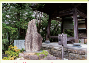
4 芭蕉の句碑 芭蕉が島田宿に立ち寄った折に詠んだとされる「馬に寝て 残夢月遠し 茶のけぶり」の句碑。 JR金谷駅より南へ徒歩約3分