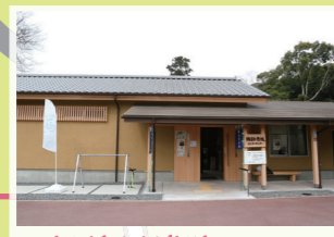
5 諏訪原城跡 武田信玄が砦を築き、その後徳川氏に対する備えとして信玄の子勝頼が築いた山城。お土産品の御城印が人気。 島田市菊川11174 ※諏訪原城ビジターセンターの住所