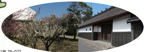
黒田家代官屋敷 (当日は梅まつり開催中)