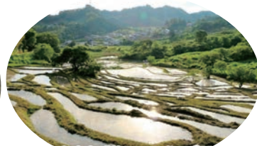
世界農業遺産「静岡の茶草場農法」認定 倉沢の棚田 せんがまち 見学