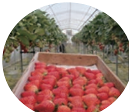
美味しい「紅ほっぺ」のいちご狩り